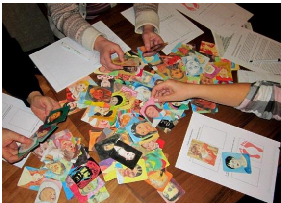
Рисунок 3 — Примеры занятий с использованием метафорических ассоциативных карт в дошкольном образовании

План занятия с использованием метафорических ассоциативных карт (МАК) для дошкольников можно организовать на основе трех этапов: введение в материал, основная часть и рефлексия. Важно учитывать возрастные особенности детей и создавать доступные, интересные и увлекательные активности.