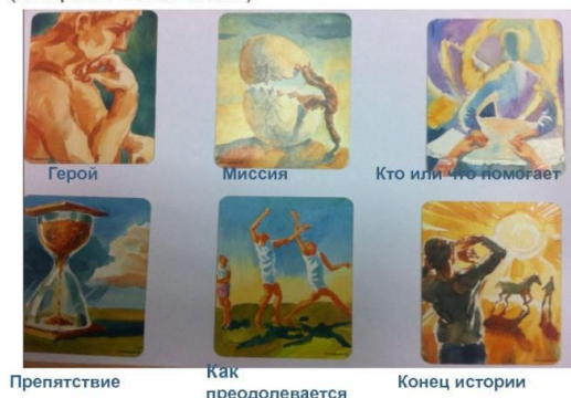
Рисунок 1 — Методика работы с метафорическими ассоциативными картами в дошкольном образовании

Методика: использование метафорических ассоциативных карт «СОРЕ» (история в шести частях)