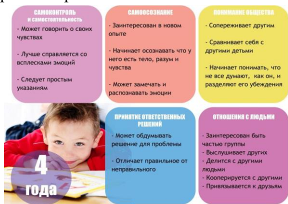
Рисунок 3 — Методы развития эмоционального интеллекта у дошкольников

обогатить этот процесс, обеспечивая необходимую поддержку для полноценного внеурочного развития.