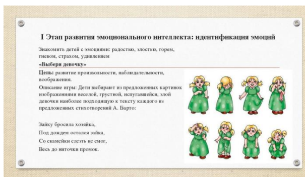
Рисунок 5 — Упражнения для развития эмоционального интеллекта у детей

Упражнения для развития эмоционального интеллекта необходимы в рамках различных методов, упомянутых ранее. Одним из эффективных средств в этом направлении является задание "Подчеркивание общности". Дети должны найти 20 общих качеств с другим человеком, что способствует формированию эмпатии и улучшению понимания окружающих. Это упражнение позволяет детям активно заниматься самопознанием и учит их находить общие интересы с сверстниками.