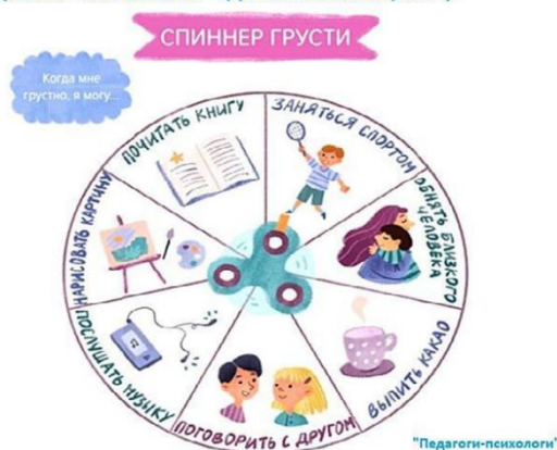
Рисунок 4 — Упражнения для развития эмоционального интеллекта у детей